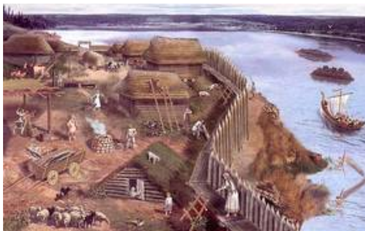
Рис. 7. Славянский поселок.

К расселению славян подталкивали особенности их хозяйства — подсечно-огневое земледелие за несколько лет истощало пашню, а отгонное скотоводство — пастбища. Избытку населения приходилось искать новые земли. Там они селились вдоль по течению рек, их притоков отдельными хуторами, состоящими из нескольких дворов. На возвышенных речных берегах у леса огнём отвоёвывались новые участки для пашни деревянными сохами с железными наральниками; отыскивались деревья- борти с медоносными пчёлами; тропы охотничьих зверей, гнездовья птиц; в речных поймах размещались промысловые угодья — огороды, сенокосы, смолокурни, солеварни, поташные выварки; рыбные ловли; кузнечные, гончарные, ювелирные, косторезные мастерские.