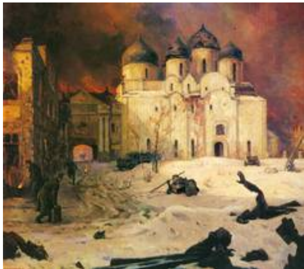
Рис. 4. Кукрыниксы. Бегство фашистов из Новгорода. 1944 г.

монумент был восстановлен в прежнем виде уже ко 2 ноября 1944 г. Ограда и фонари вокруг восстановлены к 1978 г.