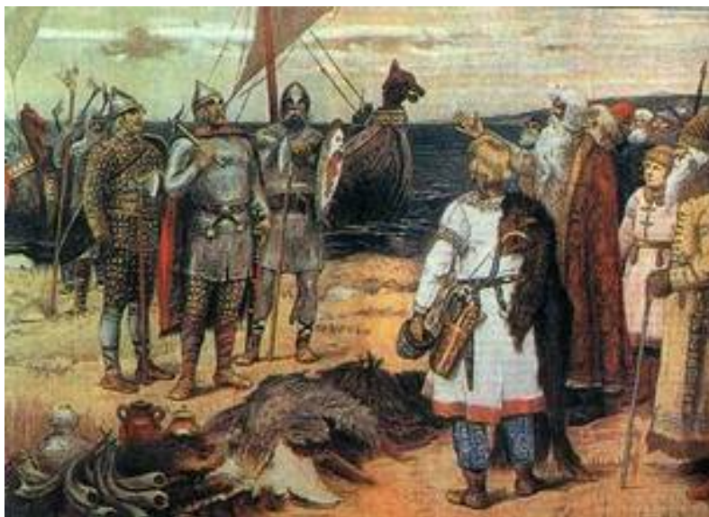
Рис. 1. В.М. Васнецов. Варяги (Прибытие Рюрика в Ладогу). 1909 г. Дом-музей художника, Москва.

Летописец Нестор под 862 годом своей «Повести временных лет» сообщает о приглашении северными «племенами», славянскими и финскими, в Новгород скандинавов-варягов «из-за моря» во главе с князем Рюриком. Тот стал первым правителем страны, получившей название Руси, а его семейный «род» и дружина составили ядро административного аппарата этого государства.