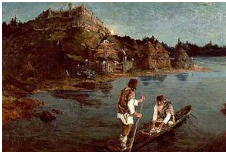
Рис. 13. Н.К. Рерих. Гонец («Восстал род на род»). 1897 г., Третьяковская галерея.

Выход из положения они нашли, собрав вече — народное собрание. Решено было послать за море послов, поискать для них всех единого князя с таким призывом: «Земля наша велика и обильна, а порядка в ней нет. Приходите княжить и владеть нами, [но уже] по ряду [договору] и судить по праву [установившемуся у нас]» . На призыв откликнулись трое братьев со своими семьями, родичами и союзниками — Рюрик 40 , Синеус 41 , Трувор 42 . Сначала они обосновались в Ладоге, а потом Рюрик переместился в Новгород, рядом с которым доньше существует Рюриково городище — бывшая резиденция здешнего князя и его дружины. Синеус занял Белоозеро, а Трувор Изборск — соответственно, «племенные» центры финских соседей и кривичей, заключивших тогда со словенами конфедеративный союз.