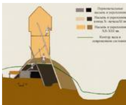
Рис. 8. Городище Капыстичи на р. Сейме в Курской области. Роменская археологическая культура IX – начала XI вв. Раскопки (разрез вала) и реконструкция перевоземляных укреплений А.В. Зорина (Курский музей археологии).

Одни из этих протогородов впоследствии запустели или были разрушены врагами, зато другие превратились в настоящие города отечественного Средневековья (вроде западного Смоленска, южного Киева или, допустим, юго-восточного порубежного Курска).