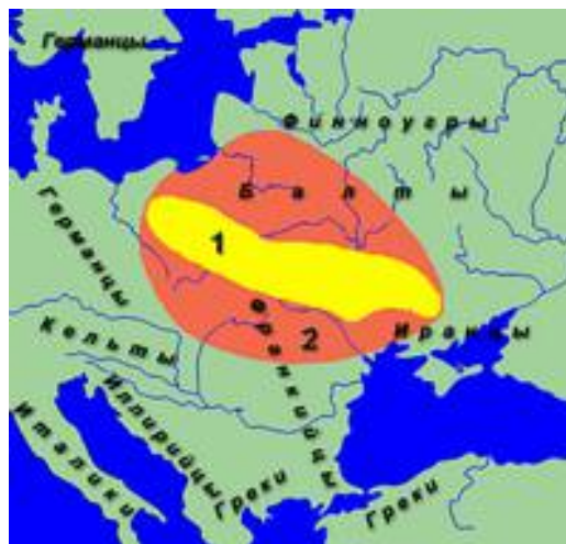
Рис. 5. Прародина славян (по данным археологии и лингвистики).

По ходу своего этногенеза эти народы взаимодействовали, обменивались культурными достижениями и соответствующими им языковыми терминами. Например, в славянских языках германизмами являются такие слова, как князь, хлеб, купить, долг, меч, шлем, котёл, блюдо и др.; иранизмами бог, хорошо, топор, собака, лошадь, хата и др.; почти у всех этих слов есть и собственно славянские кальки: вождь, жито, всевышний, добро, секира, пёс, миска, конь, дом и т.п.