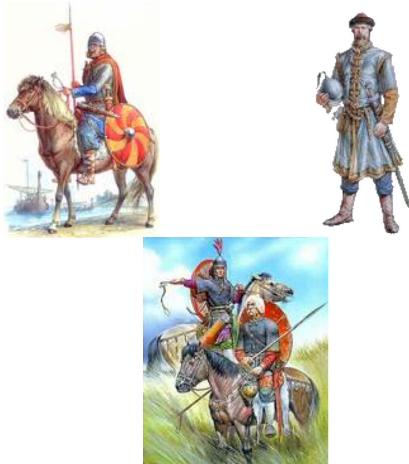
Рис. 14. Варяжские воины на Руси.

ками Тора», ручными браслетами и перстнями из бронзы и серебра; снаряженный маленькими весами для драгоценных металлов и камней, шкатулкой и кошельком для их хранения; инструментом для ремонта ладьи и конской сбруи — таков внешний облик руса, восстанавливаемый археологами по находкам с их поселений и из могил.