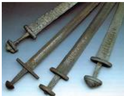
Рис. 10. Образы субкультуры викингов.

Корабль-дракар: в процессе раскопок; после реконструкции и консервации; Шлем викинга. Европейские мечи раннего Средневековья.