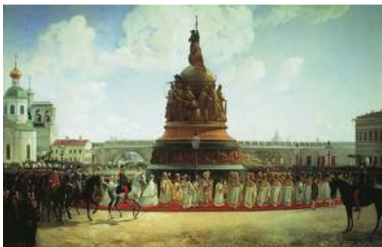
Рис. 3. Б.П. Виллевальде. Открытие памятника «Тысячелетие России» 8 сентября 1862 г.

Чтобы по достоинству оценить этот шаг, следует иметь в виду, что вплоть до конца XIX века по всей тогдашней империи насчитывалось всего до 50 монументов (включая часовни), посвящённых историческим лицам и событиям. В самой Москве тогда имелось только три памятника: Минину и Пожарскому, Пушкину, Ломоносову.