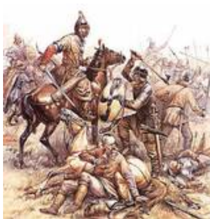
Рис. 12. Хазары.