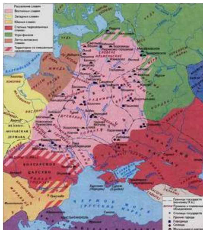
Рис. 9. Расселение восточных славян накануне образования Руси.

Соседями восточных славян на севере оказались финно-угры и те же балты, а на юге потомки ираноязычных сарматов аланы и задержавшаяся здесь часть болгар; наконец, новые кочевники — тюрки (авары, печенеги, затем надолго половцы).