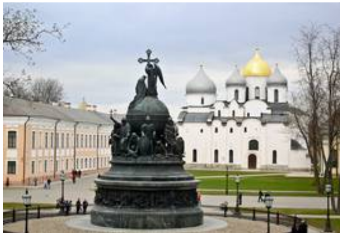
Рис. 2. Памятник «Тысячелетие России». Новгород Великий. Справа Софийский собор (1045–1050 гг. постройки) — древнейший сохранившийся храм на территории Восточной Европы. Современный вид.

Почти тысячу лет спустя император Николай I своим указом от 21 августа 1852 г. официально признал 862 год началом российской государственности 36 . А ещё через десять лет, 8 сентября 1862 года в Новгороде Великом был торжественно открыт памятник «Тысячелетие России».