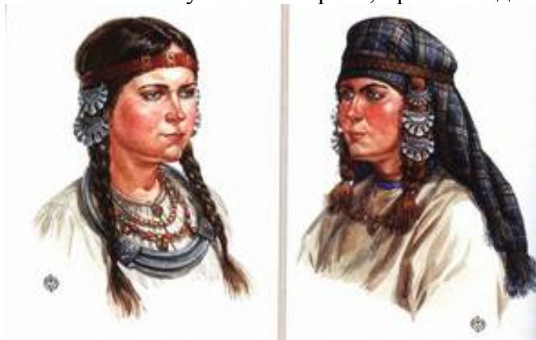
Рис. 6. Убор славянок «племени» вятичей (по материалам курганных раскопок). Реконструкция О. Фёдорова.

труднительно определить те или иные археологические культуры 37 как безусловно славянские. Дело в том, что этничность (начиная с языка) и материальная культура, остатки которой раскапывают археологи, не всегда совпадают. Предки славян могли входить как один из этнических элементов, преобладающий или подчинённый, в археологические культуры, сначала поочерёдно, а затем совместно занимавшие юг Восточной Европы с начала I тыс. н. э., каковы зарубинецкая, киевская, пражско-корчакская (склавины?), пеньковская (анты?), колочинская (венеды?), волынцевская . Их объединяют такие признаки, как обряд похорон (трупосожжение); тип жилища (полуземлянки, топившиеся по-чёрному, без дымоходов, с печками из глины или камней по углам); комплекс хозяйственного инвентаря (лепная от руки, без гончарного круга баночного типа посуда; железные серпы, топоры, двушипные наконечники стрел, ромбовидные наконечники копий, прочее); набор престижных украшений костюма, всегда различавшихся у отдельных группировок славян (разного облика фибулы — застёжки для верхней одежды; височные кольца, вплетавшиеся в женскую причёску, либо носившиеся в ушах как серьги; прочие подвески).