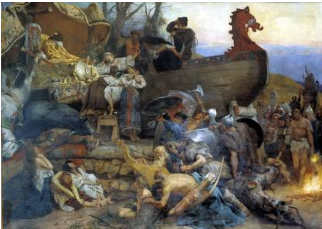
Рис. 11. Похороны знатного руса. Генрих Ипполитович Семирадский (1873–1902). Панно для интерьеров Русского (теперь Государственного) Исторического музея в Москве. 1883 г. По мотивам рассказа арабского дипломата Ибн Фадлана о поездке на Волгу и раскопок кургана Чёрная могила конца X в. в Чернигове.

Начав с разграбления отдалённых североевропейских монастырей, викинги на больших быстроходных кораблях- дракарах совершали предельно дальние по тем временам плавания. Они достигали Британии, Франции, Испании, Италии, Северной Африки; открыли и заселили Гренландию (около 874 г.), Исландию (982); первыми из европейцев достигли берегов Северной Америки (около 985–995). Жертвами их агрессии становились такие города Европы, как Лондон и Дублин, Антверпен и Гамбург, Кёльн и Бонн, Париж и Орлеан, Пиза и Генуя, Лиссабон и Севилья.